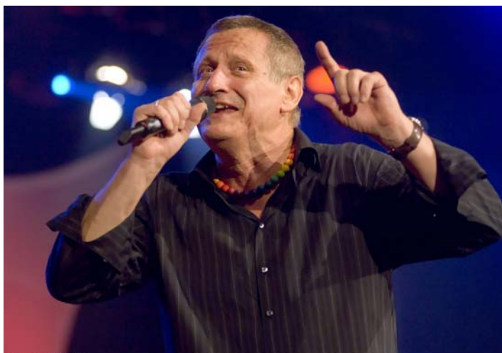
Sparkasse Langen-Seligenstadt

Erfolg hatte er nicht immer. Dafür meistens eine Botschaft. Am Flügel und Mikrophon singt er seit vierzig Jahren gegen die Mächtigen und die Machtverhältnisse in der Welt an. Trotz seiner bewegten Lebensgeschichte ist Konstantin Wecker seit Langem eine Konstante in der Musikszene dieser Republik. Zu sehr drängen sich die aktuellen Themen auf, wollen die Missstände in der Gesellschaft angeprangert werden. Dies tut Konstantin Wecker auf seiner "Leben im Leben - Tour" auf gewohnte Weise.